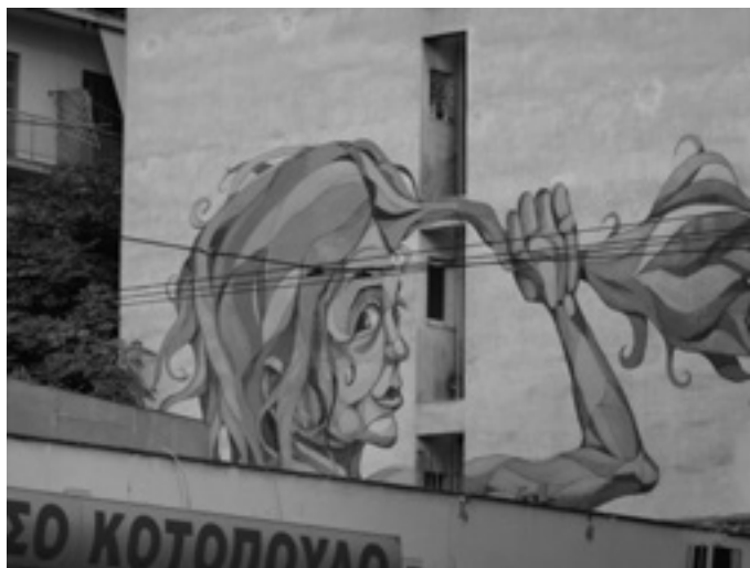
murales ad Exarcheia

“La disputa intorno agli scopi e ai vincoli dell'euro ha soffocato L'Europa. [...] Chiedersi se c'è vita oltre l'euro equivale a interrogarsi sull'utilità stessa dell'Unione Europea rispetto ai fini proclamati. Siamo in vista dell'abisso. Dovrebbe dunque scattare in tutti noi un riflesso conservativo. Non per serbare, con qualche ritocco, questo sistema sufficientemente barocco. Per rifondarlo e riportarlo al suo compito di ispirare e regolare la convivenza di una comunità di popoli irriducibili a uno.” (editoriale di Limes , n. 7/2015)